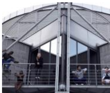
Les insolites , Théâtre du Crochetan (Monthey)